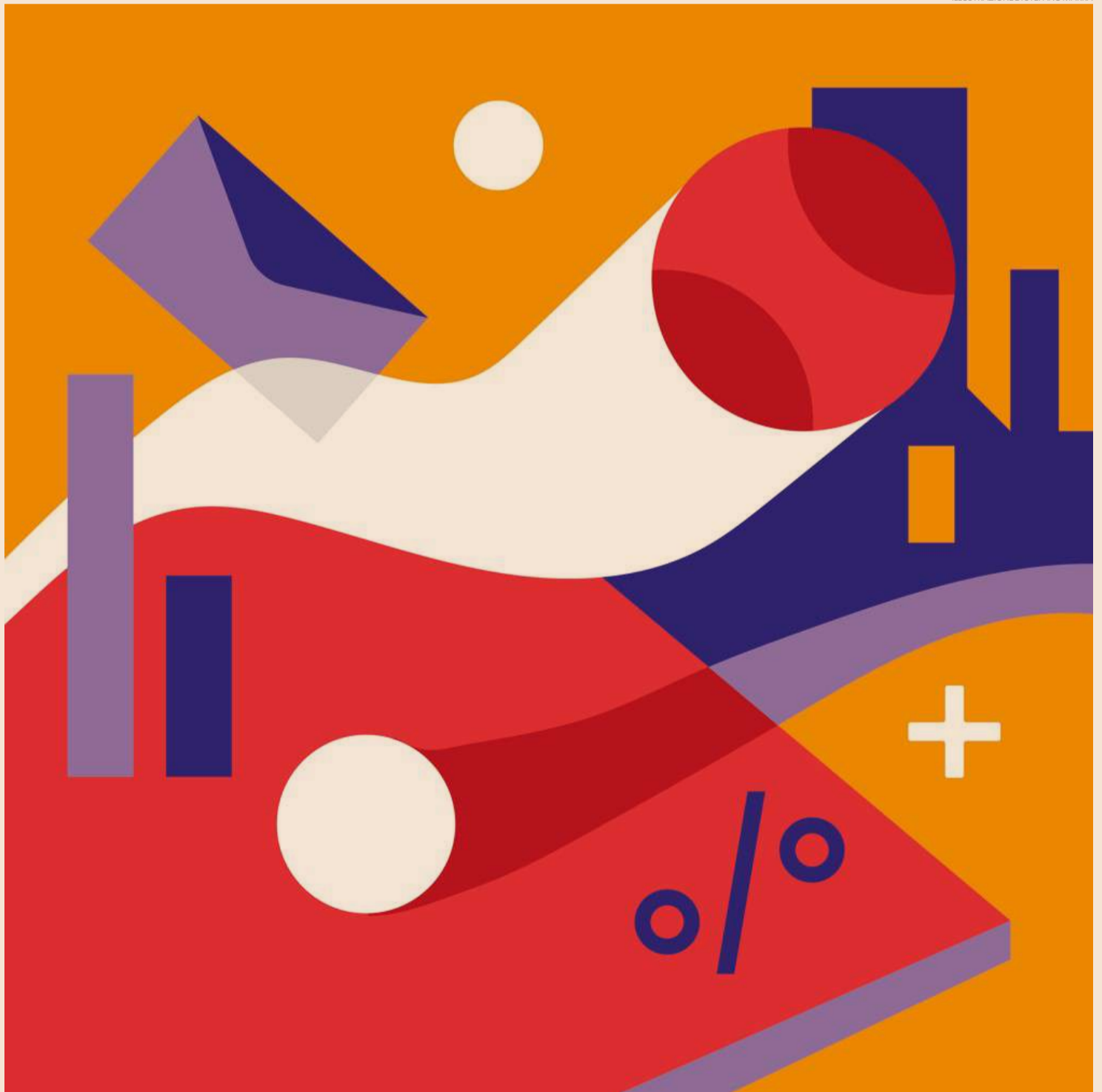
ILLUSTRAZIONE DI STEFANO MARRA